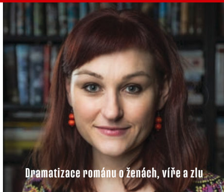
Dramatizace románu o ženách, víře a zlu