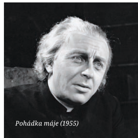
Pohádka máje (1955)