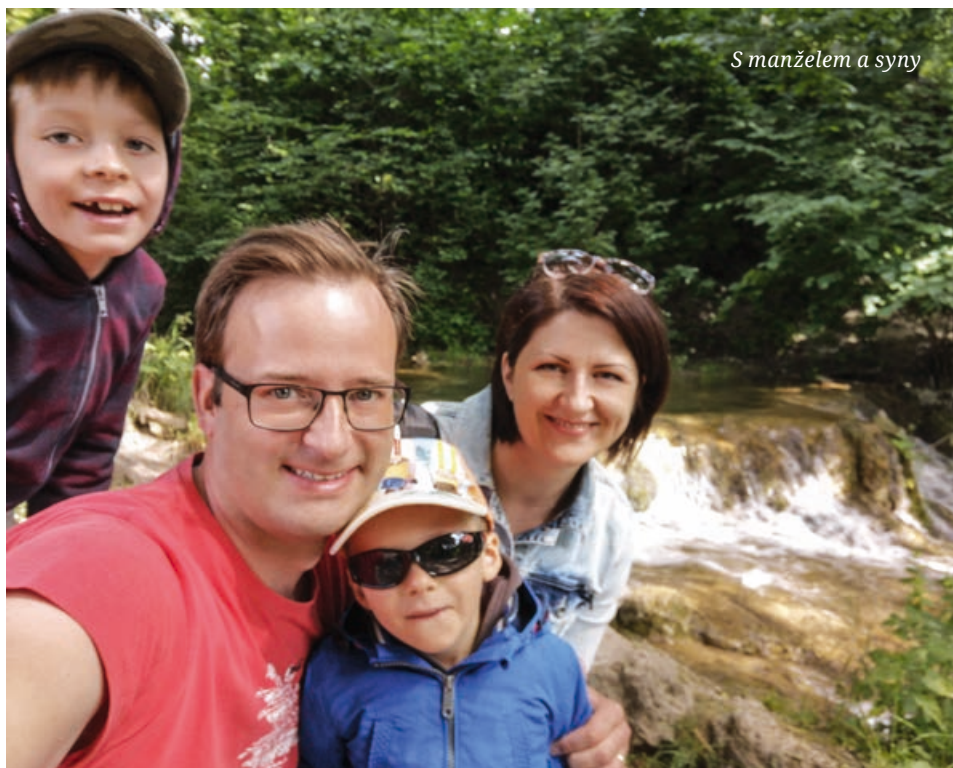
S manželem a syny